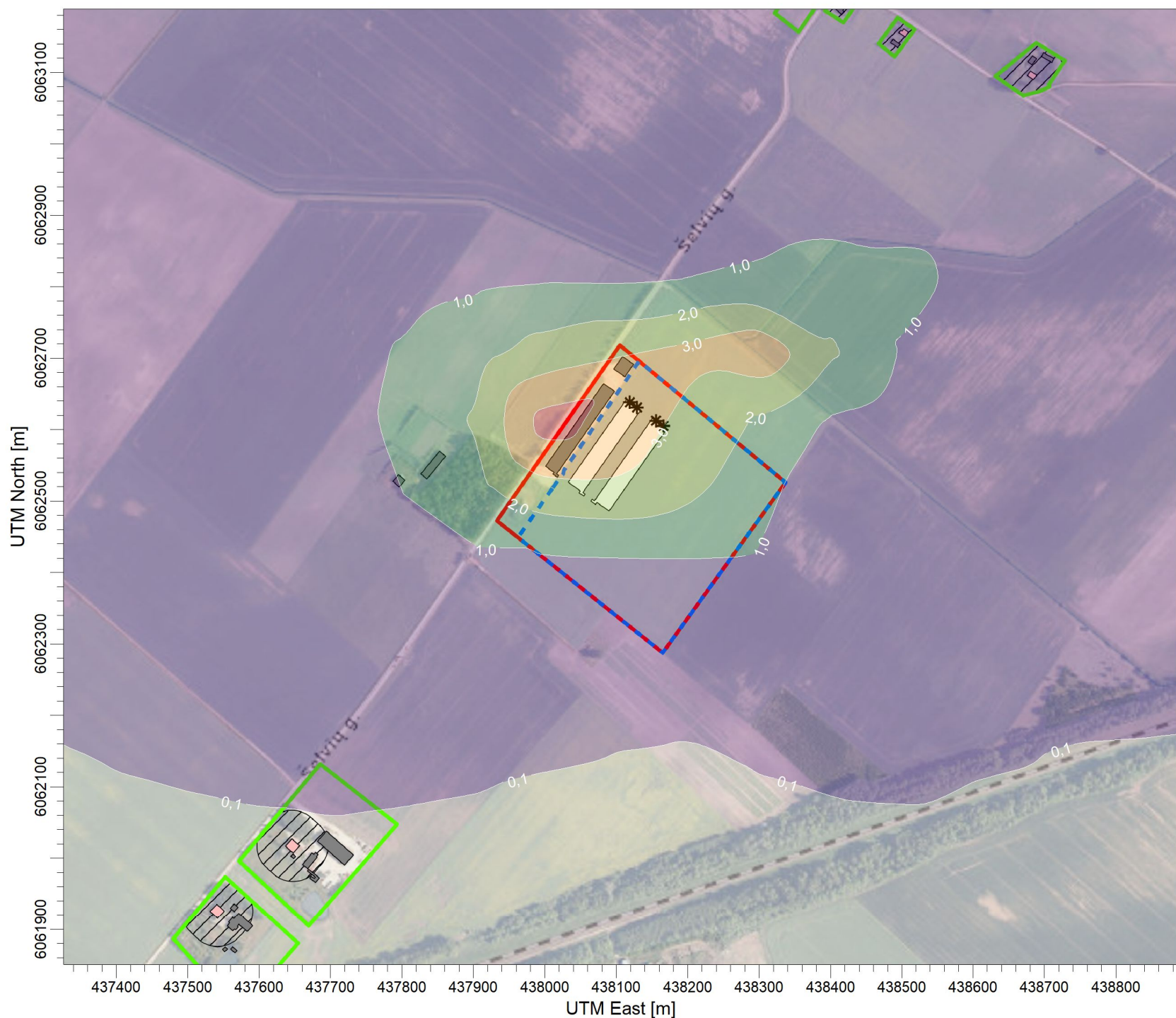
PLOT FILE OF 98.08TH PERCENTILE 1-HR VALUES FOR SOURCE GROUP: PUV Max: 4,4 [OU/M**3] at (438001,95, 6062609,88)