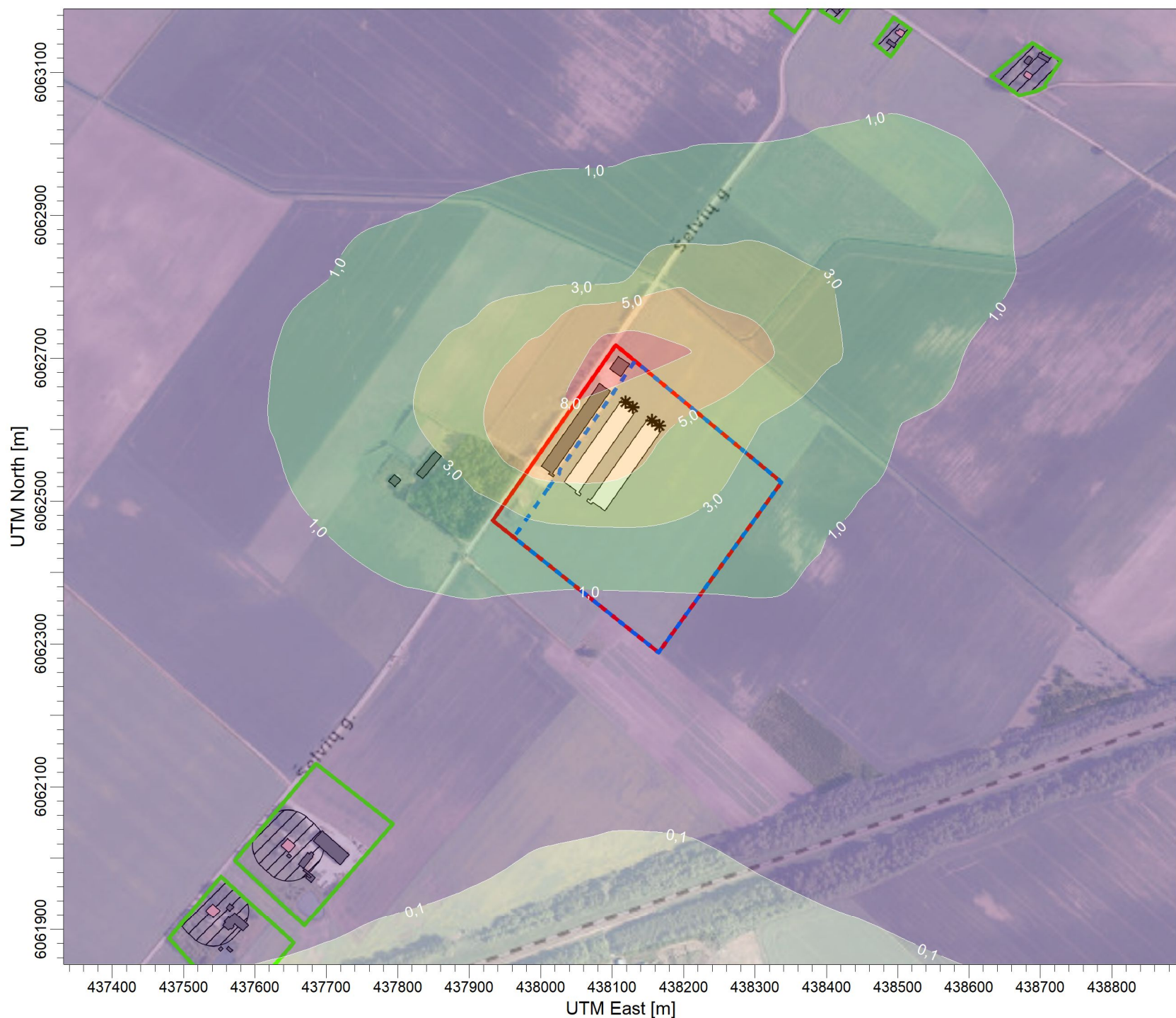
PLOT FILE OF 98.08TH PERCENTILE 1-HR VALUES FOR SOURCE GROUP: ALL Max: 9,2 [OUM**3] at (438105,70, 6062717,46)