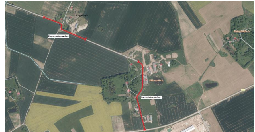
1 pav. Preliminari planuojamų asfaltuoti kelio atkarpų schema

Asfaltavimo darbai, pritarus rajono tarybai, būtų finansuojami Linkuvos ŽŪB ir Pakruojo rajono savivaldybės lėšomis, bendrovė padengtų 40% asfaltavimo išlaidų, o rajono savivaldybė 60%. Šiuo metu Linkuvos žemės ūkio bendrovė jau yra parašiusi ir pateikusi prašymo raštą savivaldybei dėl asfaltavimo darbų. Šis prašymas bus svarstomas rajono savivaldybės taryboje. Pritarus savivaldybės tarybai dėl šio kelio asfaltavimo, liepos – rugpjūčio mėnesiais bus rengiamas techninis projektas, o rudeniiui jau turėtų būti išasfaltuotas kelias. Šiuo metu rengiami dokumentai, reikalingi kelio asfaltavimo darbų pradžiai.