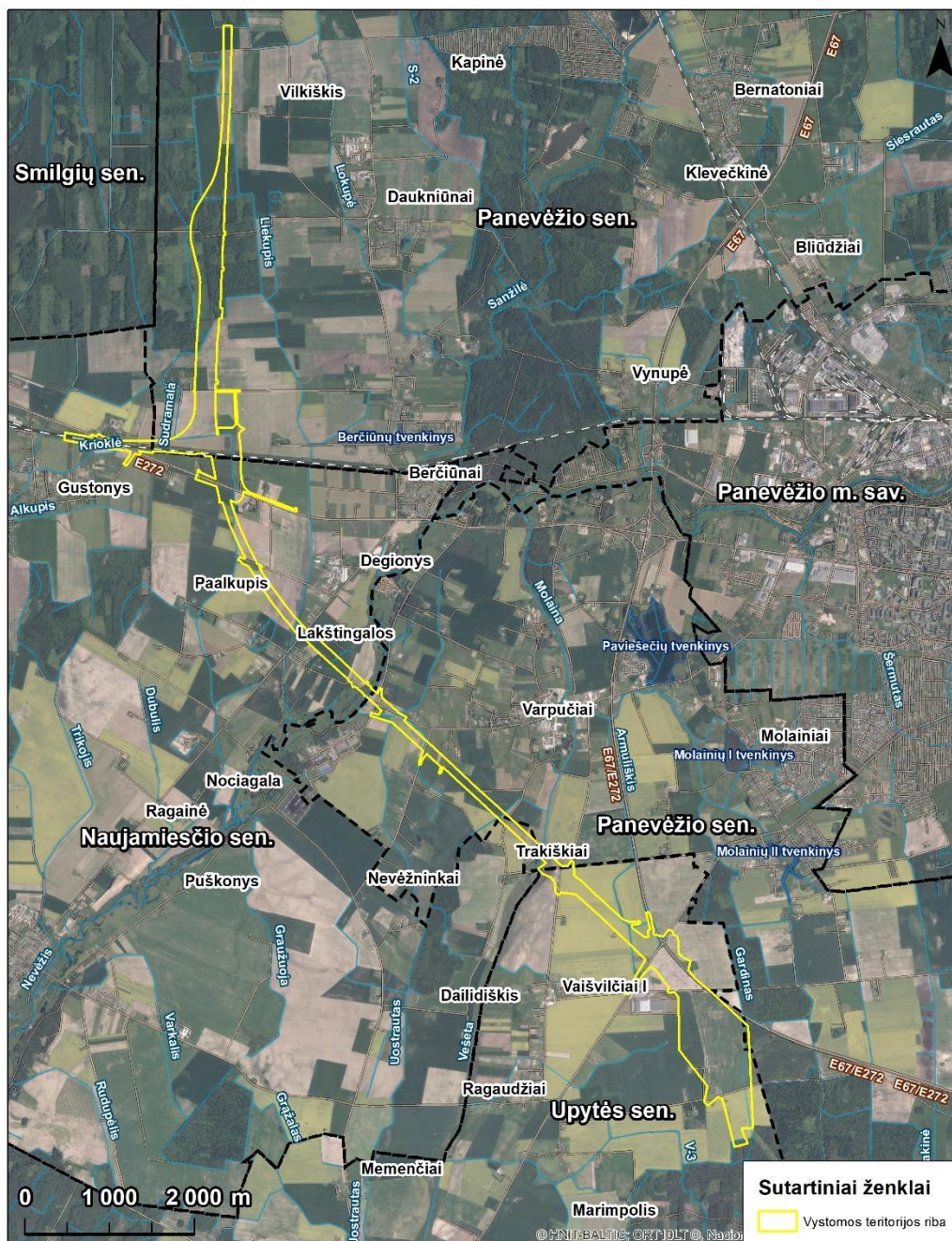
2 pav. Analizuojamų IIVP sprendinių vieta

IIVP sprendiniai (2 pav.) patenka į Panevėžio rajono savivaldybės Panevėžio, Smilgių, Naujamiesčio ir Upytės seniūnijų ribas. Rengiant PAV ataskaitą galimas lokalus PŪV ribų koregavimas.